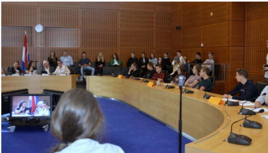
Jongerengemeenteraad Meppel kiest voor straattuintjes.

Geplaatst op maandag 8 oktober 2018 19:59