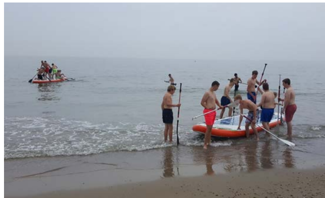
Suppen bij de Brouwersdam: goede samenwerking was vereist om vooruit te komen