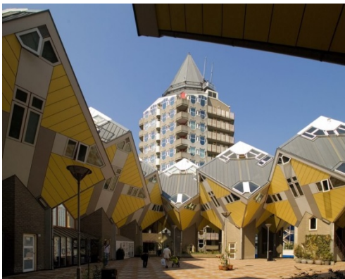
Ons verblijf in Rotterdam: de kubuswoningen van architect Blom