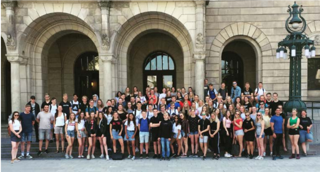
Groepsfoto voor het stadhuis van Rotterdam

De schoolreis van de leerlingen uit de derde klas theoretische leerweg naar Rotterdam en Zeeland (alweer een tijdje geleden) was een geslaagde reis met veel nieuwe indrukken voor onze leerlingen. Na een wandel-quiz-route langs de Rotterdamse haven en het beklimmen van de Euromast gingen de leerlingen een nachtje slapen in de beroemde kubuswoningen van architect Piet Blom in Rotterdam. De tweede en derde nacht verbleven wij in tenten op een camping bij de Brouwersdam in Zeeland. Hier stonden strandactiviteiten (zoals boogschieten, power-kiten, suppen en frisbee), zwemmen, zelf koken en natuurlijk veel gezelligheid op het programma. Het was voor de begeleiding ontzettend mooi om te zien hoe goed de leerlingen aan de slag gingen om voor hun tentgroepje een lekkere maaltijd van soms zelfs meerdere gangen te koken. Het weer was goed tot aan het inpakken van de tenten in de regen. Maar ook dat hebben onze leerlingen goed voor elkaar gekregen. Wij kijken terug op veel mooie en interessante herinneringen met deze groep!